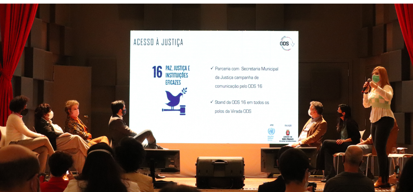
>> Evento de lançamento da Virada ODS, na Praça das Artes.

Considerando a parceria com a Organização das Nações Unidas, o evento contará com personalidades internacionais associadas aos ODS, como o ex-secretário Geral ONU no período de 2007 a 2017, o diplomata e político sul-coreano, Ban Ki-Moon.